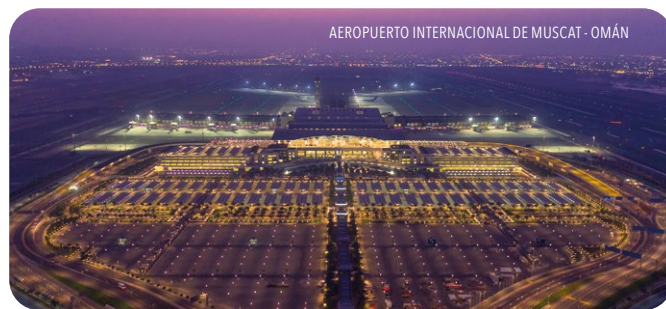
AEROPUERTO INTERNACIONAL DE MUSCAT - OMÁN

Estos son algunos de los proyectos más relevantes de los últimos años en los que nuestros cables han estado presentes.