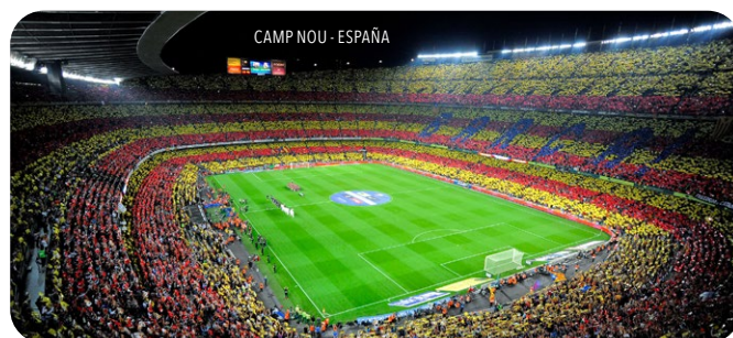
CAMP NOU - ESPAÑA